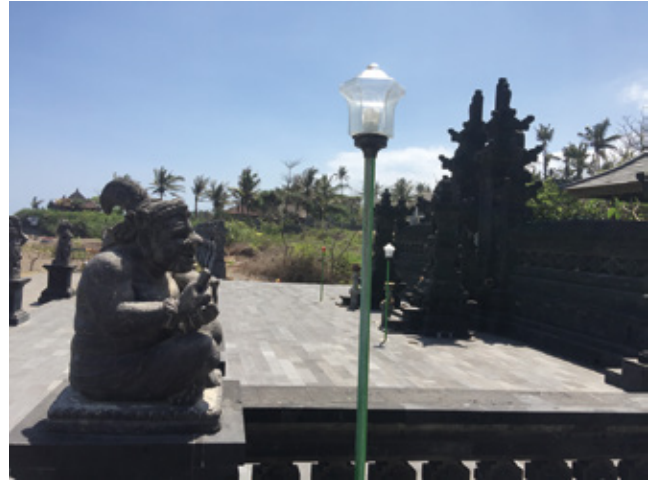
図4 セセ海岸のスプーの聖廟

アラーがスプーに与えたいくつかの奇蹟の1つは水上歩行である。この力が、メングウィ王である父親の嫉妬を引き起こすことになった。ある日、スプーは王族の隠れ家の場所であるメングウィのタマン・アユンに行くように言われた。タマン・アユンとは、湖と美しい庭園に囲まれた建物である。そこ