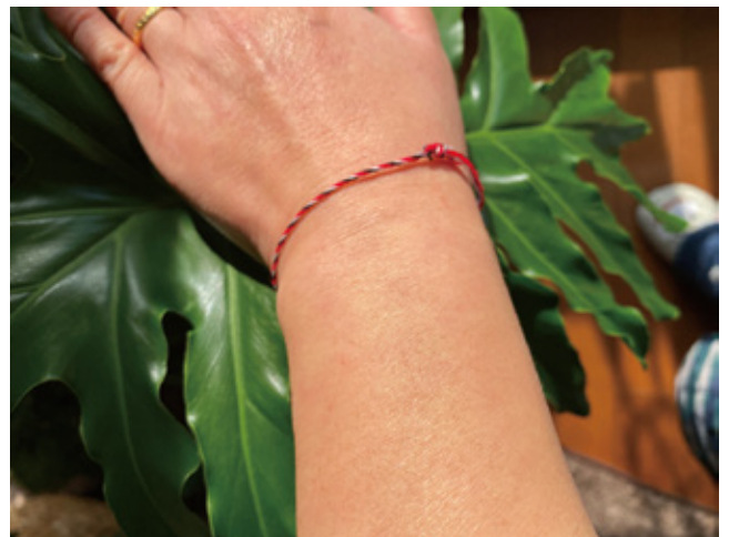
図 6 現代での TriDatu

第二に、バリにはウサダ（usada）というヒンドゥー伝統の治療法があるのだが、ウサダに関する文書“Tutur Wekasing Majapahit : Usada Kacacar”（「マジャパヒトの終幕に関する秘密の、神秘の知識：天然痘の処方」）では、天然痘を撃退するマントラ（呪文）の中に「アッラー」「イスラム聖者」「称号」「聖地の名前」といったイスラム的要素の用語が登場する（大木 1996）。このことからバリヒンドゥーは、イスラム教を拒んではいたものの、病を治すイスラムの神秘性を意識し、その力を借りようとしていたことが分かる。スプーの異本でも彼の示した病気治しの奇蹟が強調されていたが、それと同じ構造がここでも見て取れる。スプーの異本ともども、ヒンドゥー側に深く受容されているイスラム的要素が強調されていることが窺える。