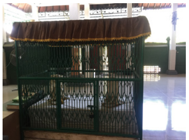
図2 アブ・バカールの聖廟内観

異本 (3) では、他の異本と同様に馬が王から与えられたものだったことへの言及はあるが、アブ・バカールが自宅に戻る途中で皇太子に出会ったとの記述がない。その代わり (と言うべきかどうか判断は分かれるかもしれないが)、彼が襲撃された場面の記述はより残虐なものになっている。血まみれで地面にひざまずいた様子や、逆に、彼の墓から炎が上がり、彼ら一人一人を燃やし続けたことが述べられている。原本に比べて暴力の記述が生々しいのである。