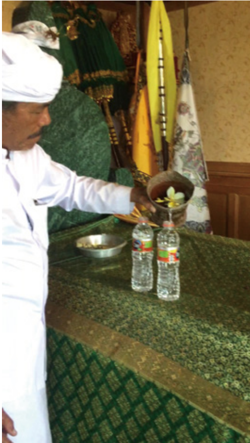
図3 スプーに供えた水を薬にする司祭