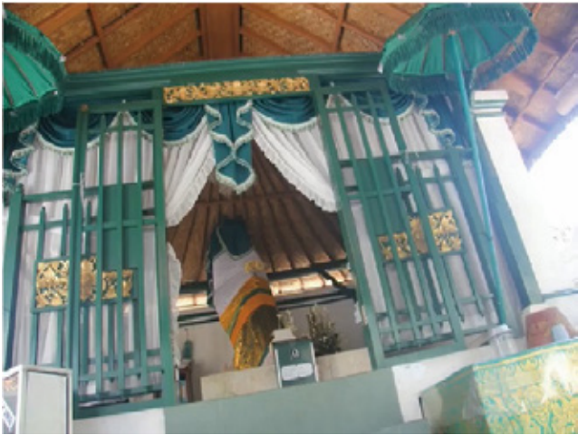
図5 屋根を突き破るコディジャの墓石 36)

らにその光はデンパサールの街全体が照らされた。彼女が黒魔術師ではないことが判明されたとき、悲鳴のように makebar makebar makebar と3回響き渡った。彼女は“ALLAHU AKBAR”（「アッラーは偉大なり！」）と叫んでいたのだ (Budi 2018) 35) 。