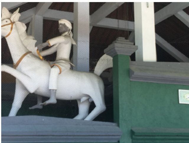
図1 白馬に乗った聖人アブ・バカール像

ここでも全般的なプロットは原本を概ね踏襲しているが、いくつかの点で記述に興味深い相違が見られる。ひとつは、アブ・バカールはたんに語学教師だったのではなく、王の秘書として仕えるほど王からの信頼が厚かったという点である。また、異本 (1) に続いて、馬がもともと王から与えられたものだったことへの言及もある。そして、皇太子がアブ・バカールに下馬するよう命じたが彼が応じなかったことへの言及があり、彼の存在と王室の関係者とのあいだに人間関係上の対立があったことが仄めかされている。