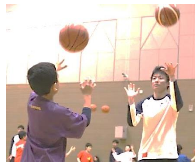
▲過去の「バスケ教室」の様子

本学硬式野球部は1964年の創部以来、首都大学野球リーグにおいて過去69回の優勝、全日本大学野球選手権大会で4回の優勝、明治神宮大会でも3回の優勝を果たしています。また、本学男子バスケットボール部は1960年の創部以来、「全日本大学バスケットボール選手権大会」において、優勝・準優勝をそれぞれ4回ずつ果たしています。