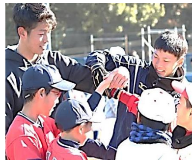
▲過去の「野球教室」の様子

本イベントは、国内でもトップレベルの実績を有するクラブの指導者・選手が子どもたちに直接指導することで技術の向上に資するとともに、大学生との交流を通じて、子どもたちの心身の発達と健康増進に役立ててもらうことを目的に開催するものです。当日は、本学硬式野球部および男子バスケットボール部の指導者・選手が子どもたちに本格的な技術指導を行うとともに、子どもたちと一緒にレクリエーションなどを楽しみます。