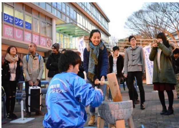
<昨年度の「新春もちつき大会」の様子>

留学生や外国につながる子どもたちへの支援・文化交流などを主な活動目的とする学部・学科・学年を超えた学生たちによるプロジェクト。これまでも留学生を対象とした「スポーツ大会」などのイベント、近隣在住の外国につながる小・中学生を対象に学習や生活のサポートをする「にこティー教室」、地域の小学生を対象とした「異文化理解ワークショップ」、地域の方や留学生を交えての「シンポジウム」など、「多文化共生」を目指すさまざまな活動を行っています。