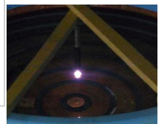
Discharge condition on saline solution