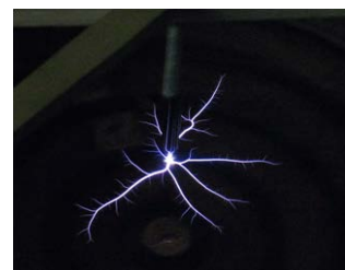
Discharge condition on tap water